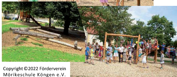
Copyright ©2022 Förderverein Mörikeschule Köngen e.V.